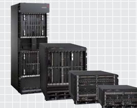
MLX シリーズ ▶ P6