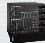
ServerIron ADX シリーズ