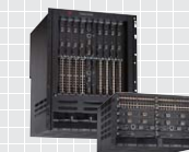
FastIron SX シリーズ ▶ P11