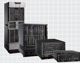
Netron XMR シリーズ ▶ P5