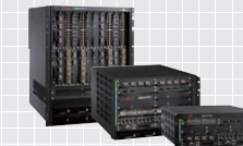
BigIron RX シリーズ ▶ P10