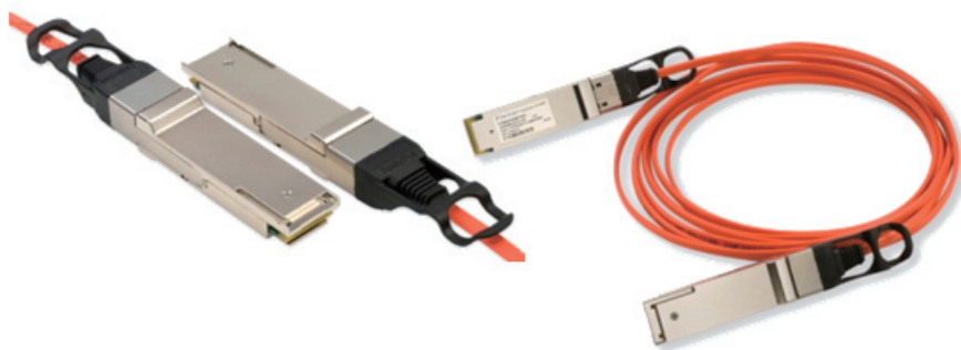
図 3. Finisar 社の Quadwire マルチモード光ファイバー QSFP

短距離のデータセンターの用途で、SFPモジュール4個とリプレースできるように作られたQSFP (Quad Small Form Factor Pluggable) モジュールは、低電力消費の光と電気のインタフェースをサポートします (図3を参照)。このモジュールは、40GBASE-CR4、40GBASE-SR4、40GBASE-LR4 (2011年) など各種イーサネットと、ファイバーチャネル、InfiniBandの用途で使用されます。その小型の形状と低コストであるため、40ギガビットイーサネット用の光モジュールとして適したものです。QSFPモジュールは、フェイスプレートがXFPと同じ寸法ですが、長さが少しだけ短くなっています (高さ8.5 mm x 幅18.35 mm x 長さ52.4 mm)。