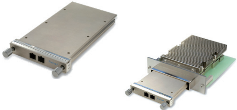
図 5. Finisar 社の CFP

CFP モジュールは、10:4 多重化装置の電力消費に対応できるサイズであるため、SMF 用には、10Gbps の物理レーン 10 本を 25Gbps の物理レーン 4 本に変換します。この 25Gbps の物理レーンが、4 本のレーザーを 25Gbps で駆動しますが、ここでも多量の電力を消費します。CFP のサイズでは、外部 WDM（波長分割多重方式）もモジュール内に収容可能で、4 つの波長すべてが 1 本のファイバーに多重化されます。CFP は、XENPAK の約 2 倍の幅になります（高さ 14 mm x 幅 82 mm x 長さ 145 mm）。100GBASE-ER4 の 40 km 長距離インタフェースが用意されるのは、2011 年か 2012 年になる見込みです。