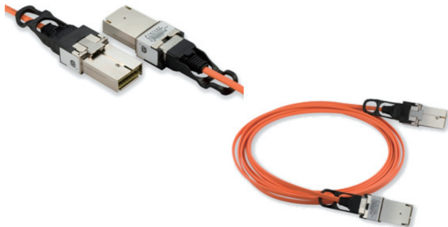
図 4. Finisar 社の C.wire MMF CXP

CXPモジュールは、SNAP-12モジュール (主にInfiniBandで使用) にリプレースできるように設計され、高密度で短距離のデータセンターネットワーク用に作られています (図4を参照)。CXPは非常にコンパクトな反面、長距離モジュール並みの出力は消費できないため、24芯平行マルチモードケーブルを使用します。CXPモジュールは、100GBASE-CR10、100GBASE-SR10、InfiniBand 12X QDRに使用されます。CXPは、XFPと比較した場合、少し大きくなります (幅27 mm x 長さ45 mm)。