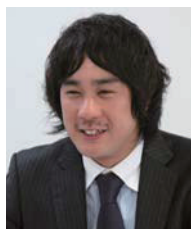
近鉄ケーブルネットワーク株式会社 技術本部 通信技術部 通信システム課

その後順次サービスエリアを拡大し、必要に応じて FES X424-HF と FES X448 を追加。2008 年 4 月にはコアリングの一部を Brocade BigIron RX-4 へとリプレースし、ネットワークをさらに強化しているのだ。