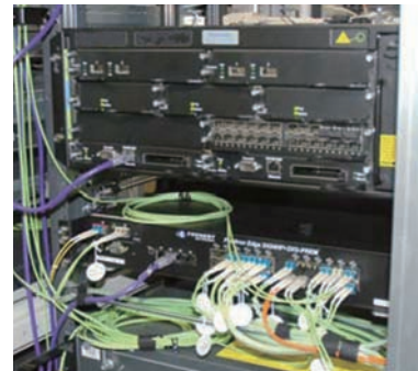
通信技術部内のサーバールームに設置された BigIron RX-4。10GbE メトロリングのコアスイッチとして2ヶ所の拠点に配置されている。

KCN の光サービスは、すでに奈良県の平野部のほとんどをカバーしているが、今後さらにエリアを拡大し、奈良県全域をカバーする予定だ。ギガビットのメトロリングもさらに拡張し、顧客の多いループは 10G 化することも視野に入っている。「ブロード製品ならモジュールを追加するだけで 10G 化できるので、低コストで拡張を行えます。将来性を考えても適切な選択だったと評価しています」